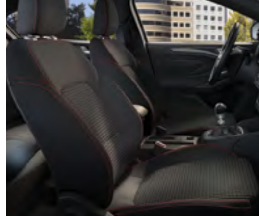
Foundry Siyah / Eton Siyah (Kırmızı dikiş detaylı ) ST-Line için Standart