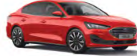
Spor Kırmızı Opak

Ford Focus şık ve dayanıklı kaportasını çok aşamalı özel bir boyama sürecine borçludur. Balmumu enjekte edilmiş çelik gövde parçalarından koruyucu boyaya, yeni materyaller ve uygulama süreçleri yeni Focus'unuzun benzersiz görünümünü uzun yıllar korumasını sağlar.