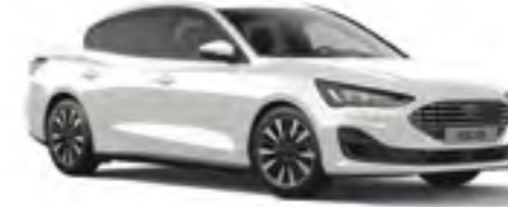
Buz Beyazı Opak