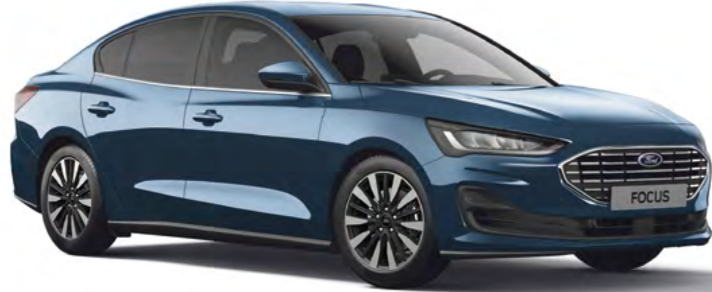
Pasifik Mavi Metalik*

İstedığınız rengi, opsiyonları ve aksesuarları seçin ve kendinize özel bir Focus yaratın.