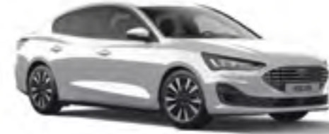
Aytozu Gri Metalik*

*Ekstra ücret karşılığında isteğe bağlı donanım