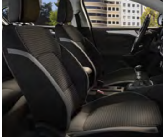
Foundry Siyah / Eton Siyah (Metal Gri dekoratif dikişli) Trend X için Standart