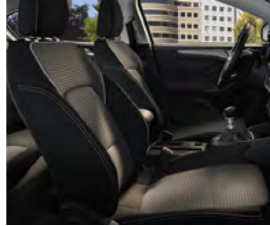
Ray Siyah / Eton Siyah Titanium için Standart