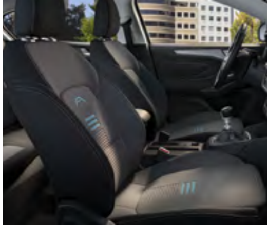
Nunatak Nordic Blue / Eton Siyah Active için Standart