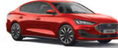
Fantastik Kırmızı Özel Metalik*