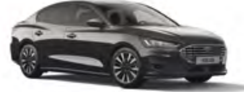
Manyetik Gri Özel Metalik*