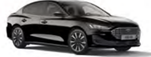
Akik Siyah Metalik*