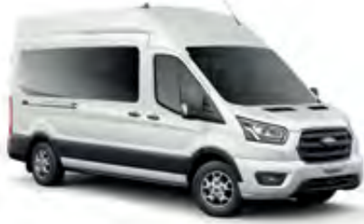
Buz Beyazı Opak

İşinizi ve markanızı en iyi yansıtan renkleri seçin.