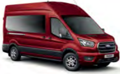
Lav Kırmızı Metalik