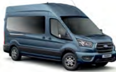
Pasifik Mavi Metalik