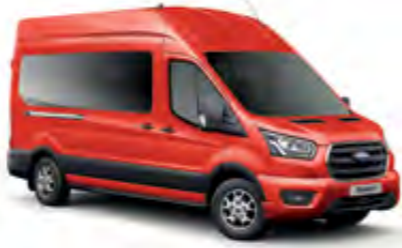
Spor Kırmızı Opak