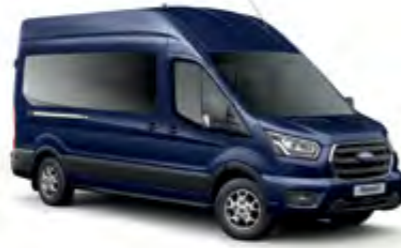
Blazer Mavi Opak