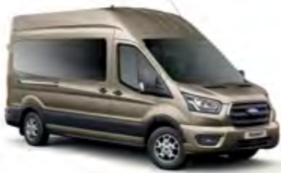
Kumsal Gri Metalik