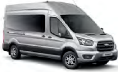
Aytozu Gri Metalik