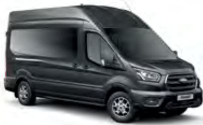
Manyetik Gri Metalik