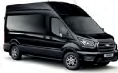
Akik Siyah Metalik