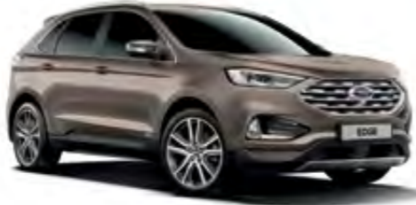
Toprak Gri Metalik*