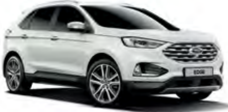
Oxford Beyazı Opak