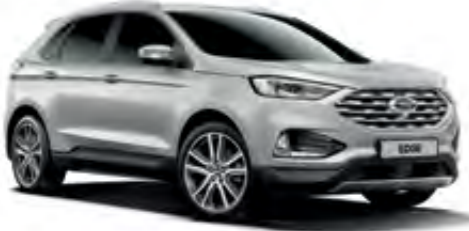
Platin Gri Metalik*