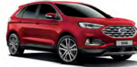
Yakut Kırmızı Özel Metalik*