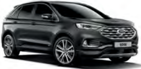
Manyetik Gri Metalik*