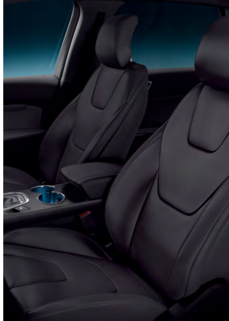
Premium Deri Döşeme Siyah

İklimlendirme özelliğiyle donatılmış koltuklar sayesinde kendiniz için en uygun sıcaklığı ayarlayabilirsiniz.