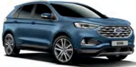
Pasifik Mavi Metalik*