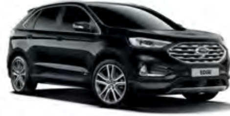
Akik Siyahı Metalik*