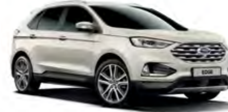
Platin Beyazı Özel Metalik*