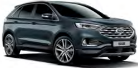
Petrol Yeşili Metalik*