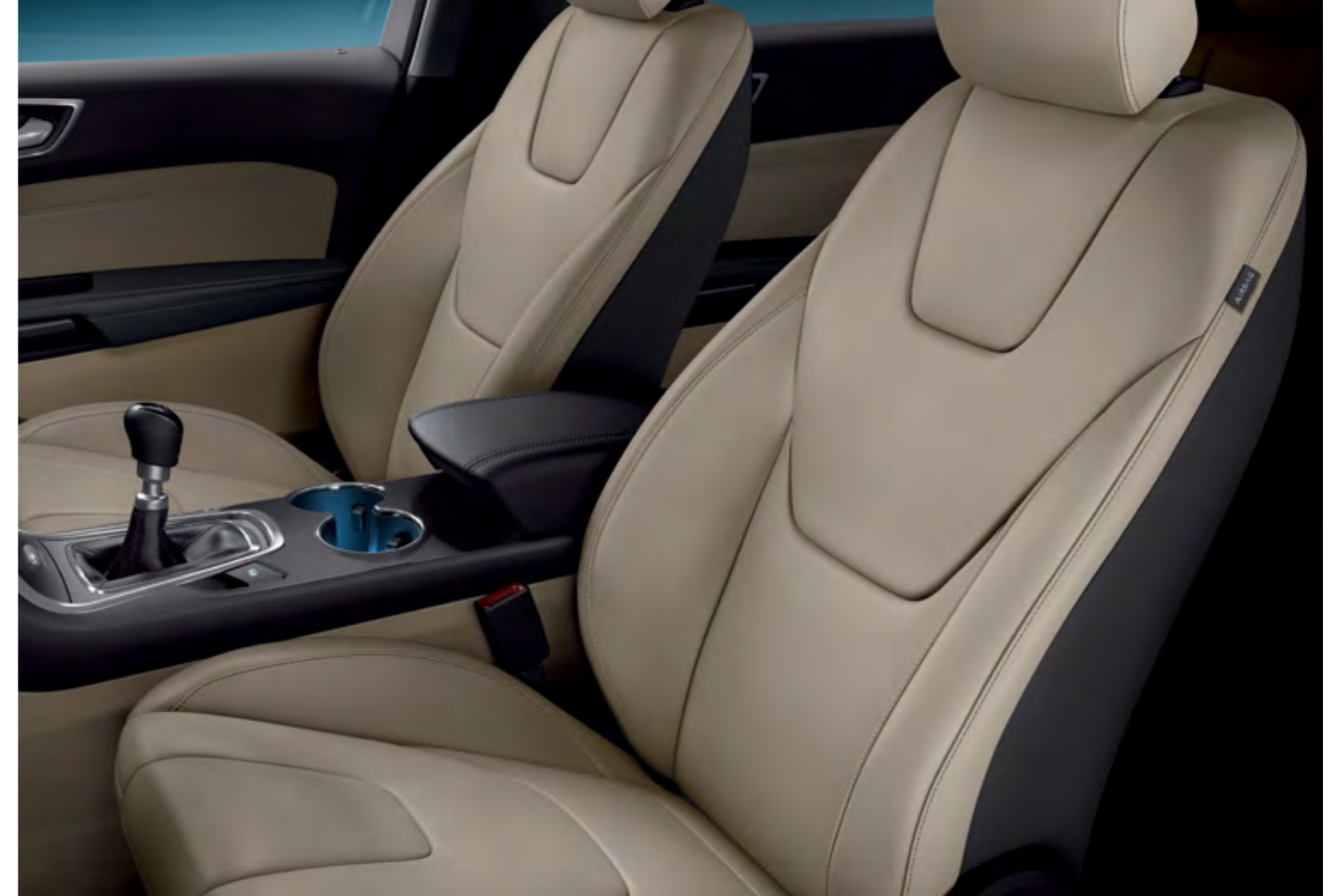
Premium Deri Döşeme Seramik