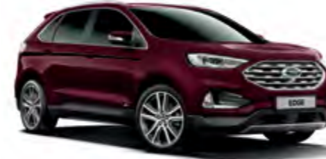
Kadife Kırmızı Özel Metalik*

Bizim tercihimiz Yakut Kırmızı'dan yana oldu. Peki, sizin favoriniz hangisi?